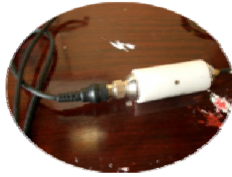
プリアンプ ケーブルの延長