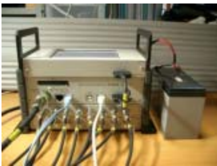
マルチレコーダー