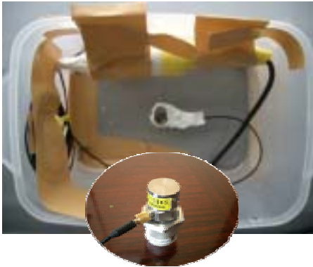
振動計ピックアップ取り付け (圧電式加速度ピックアップ)